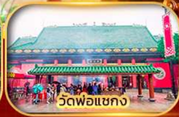
วัดพ่อแชกง