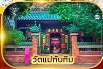
วัดแม่ทับทิม