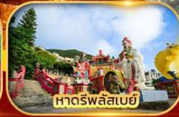
หาดริพลัสเบย์