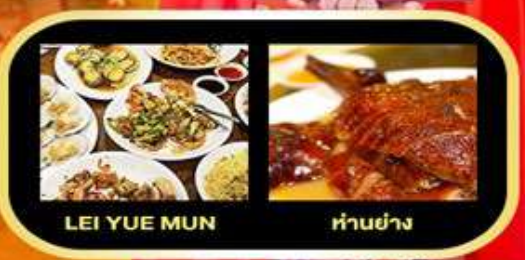
LEI YUE MUN