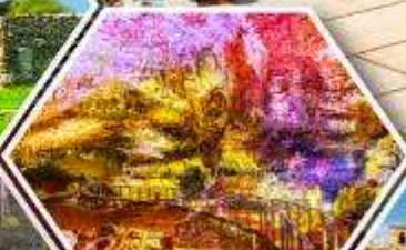
น้ำไฟมิลูส