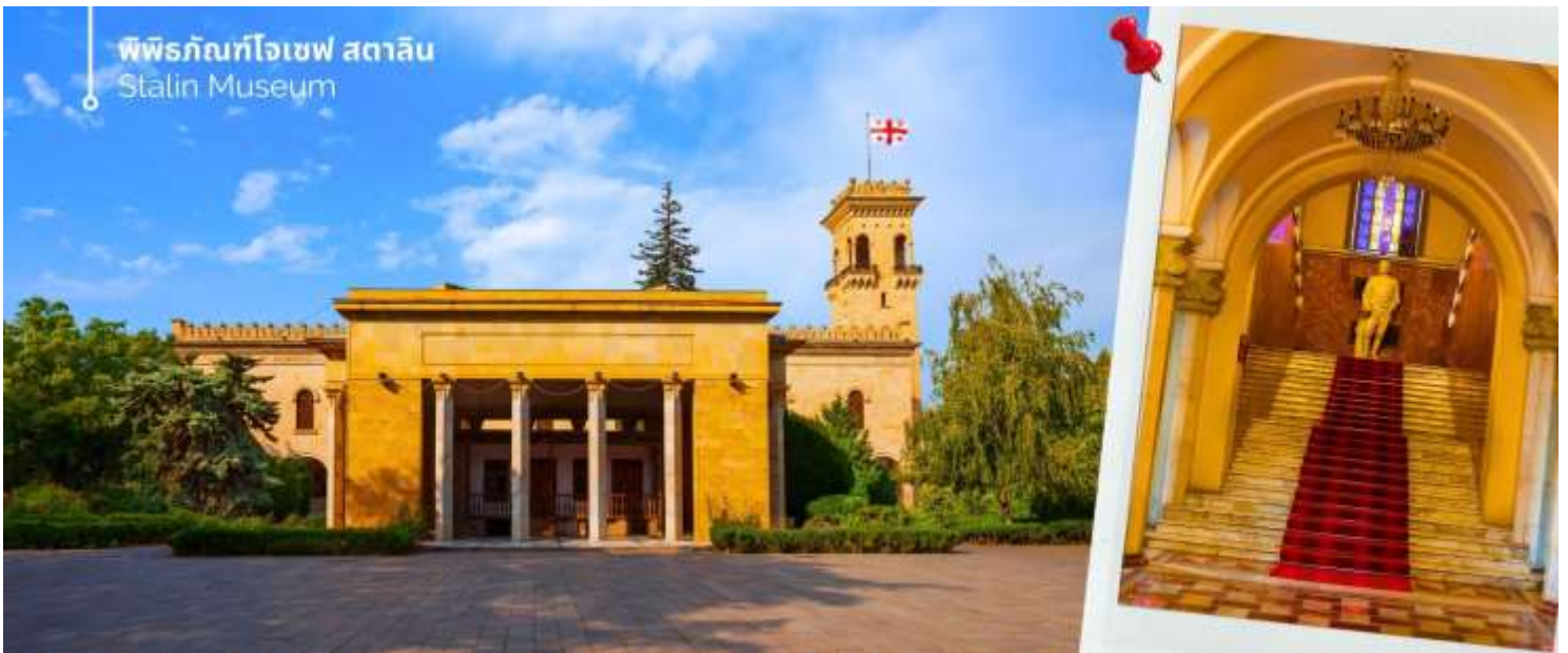
พิพิธภัณฑ์โจเซฟ สตาลิน Stalin Museum

ออกเดินทางต่อไปยังเมืองกอรี (ใช้เวลาเดินทางประมาณ 1 ชั่วโมง 20 นาที) นำท่านเที่ยวชม พิพิธภัณฑ์โจเซฟ สตาลิน (Stalin Museum) ซึ่งที่เมืองนี้เป็นบ้านเกิดของโจเซฟ สตาลิน อดีตผู้นำสูงสุดของสหภาพโซเวียต สตาลินถูกยกย่องเป็นวีรบุรุษที่นำพาสหภาพโซเวียตให้รุ่งเรือง แต่ในขณะเดียวกันก็เป็นที่รู้จักในด้านการกดขี่ข่มเหงและการฆ่าล้างเผ่าพันธุ์ พิพิธภัณฑ์แห่งนี้จึงเป็นแหล่งเรียนรู้เกี่ยวกับชีวิตและผลงานของสตาลิน รวมถึงผลกระทบที่เขามีต่อ