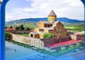
วิหารสเวตีสเดอเวรี