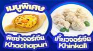
เมนูพิเศษ พิซซ่าจอร์เจีย Khachapuri เกี้ยวจอร์เจีย Khinkali

AirArabia เที่ยวบิน LA679 30 KG. Carry On + 10 KG. จำนวน 2 ใบ