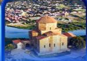
มหาวิหารจวารี