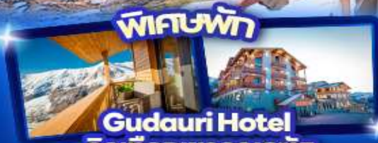
ที่พัก Gudauri Hotel วิวเทือกเขาคอเคซัส