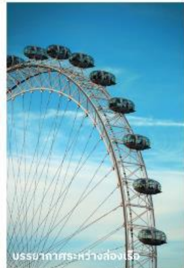
บรรยากาศระหว่างส่องเรือ

ท่านสามารถทำการสแกน QR CODE นี้ เพื่อรับชม “บรรยากาศของ Big Ben” ในรูปแบบวีดีโอ