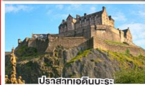
ปราสาทอดินเบระ