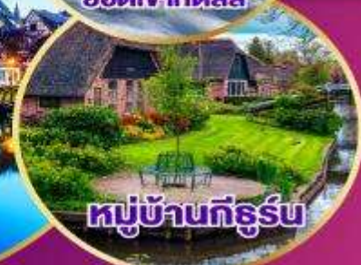
หมู่บ้านทิลูร์