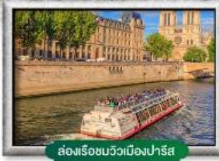
ส่องเรือชมวิวเมืองปารีส