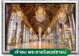
เข้าชม พระราชวังแวร์ซาย์

พิกัดกลางเมือง ใกล้ Metro เดินทางสะดวก อาหาร : 6 มื้อ โรงแรม : 4 ดาว