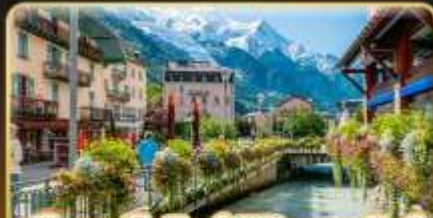
เยือนซาโมนิช พิชิตมงบลังก์