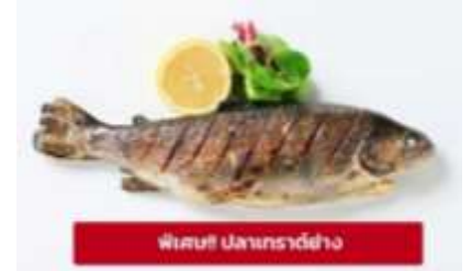
พิรุฬห์ ปลาเทราต์ย่าง

ช่วยรอดพ้นภัยทั้งจากโรคระบาด และการโจมตีของกองทัพอดิโตนันมาได้ มหาวิหารเก่าลินซ์ (Old Cathedral) หรือเรียกอีกอย่างว่าโบสถ์อิกเนเชียส ที่นี้ทำหน้าที่เป็นอาสนวิหารของสังฆมณฑลลินซ์ โรงละครลินซ์ (Neues Musiktheater) สร้างขึ้นระหว่างปี 2008 ถึง 2013 ทำหน้าที่เป็นโรงละครและโรงโอเปร่าของเมืองลินซ์