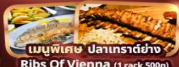
เมนูพิเศษ ปลาเทราต์ย่าง Ribs Of Vienna (1 rack 500g)

การ์นต์ 15 ท่านออกเดินทาง พร้อมหัวหน้าทัวร์คนไทย