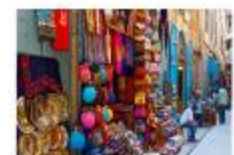
ตลาดขานเอลคาลลี

20.50 น. ออกเดินทางสู่อิสตันบูล เที่ยวบิน TK695