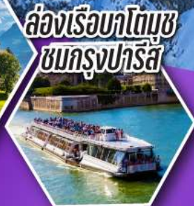
ล่องเรือบาโตมูซ ชมกรุงปารีส

เที่ยวเมืองวาอูซ เมืองหลวงของสาธารณรัฐ ลิกเทินสไตน์