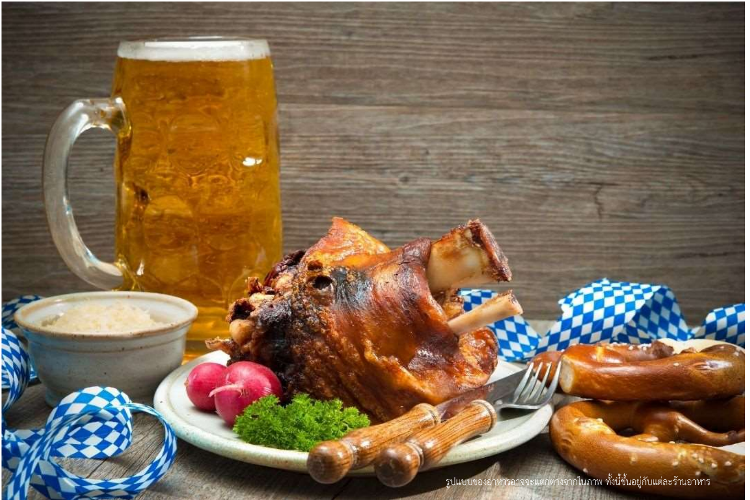
รูปแบบของอาหารอาจจะแตกต่างจากในภาพ ทั้งนี้ขึ้นอยู่กับแต่ละร้านอาหาร

วันที่สาม ฮัลล์สตัดท์-เมืองเซล์ก็ครุมลอฟ-ปราสาทครุมลอฟ