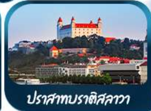
ปราสาทบราติสลาวา