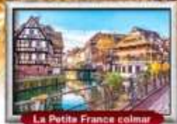
La Petite France colmar

มีนทฺุ สาขาการบิน Full Service | พิเศษ! ทอยเอสคาโก้