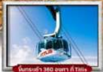
นั่งรถเช้า 300 องศา ที่ Tignes