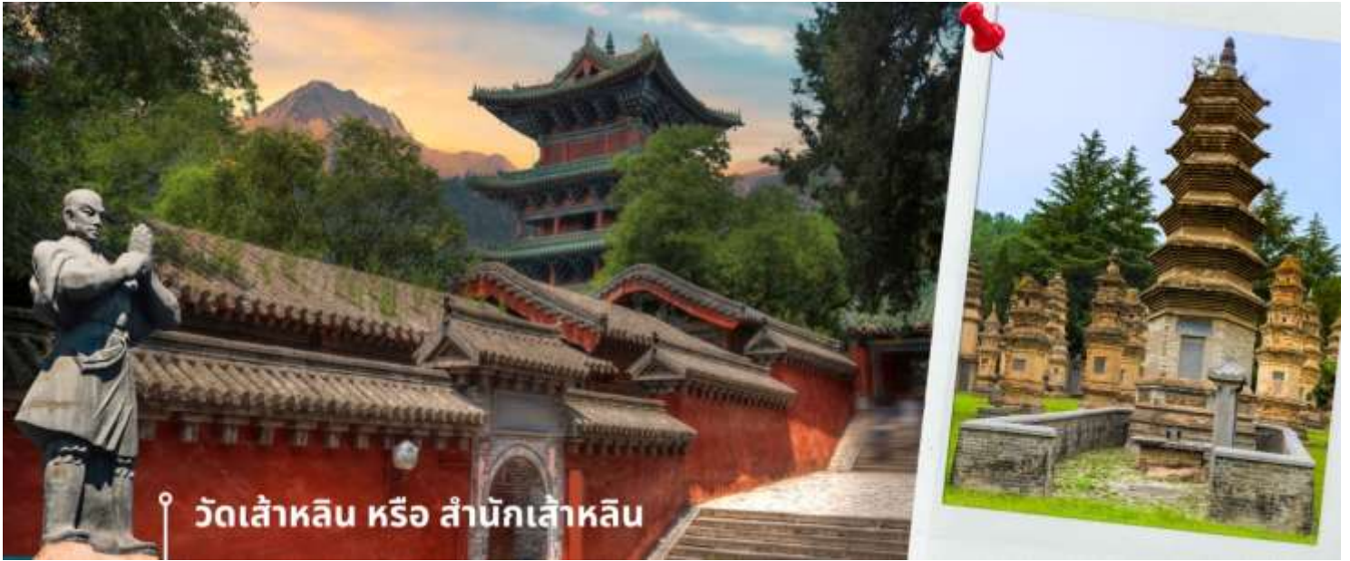
วัดเส้าหลิน หรือ สำนักเส้าหลิน

นำท่านชม ป่าเจดีย์ หรือ ถ้ำหลิน ซึ่งมีอยู่ราว 230 ที่มีความเก่าแก่ เป็นสถานที่ศักดิ์สิทธิ์ที่ตั้งอยู่ภายในบริเวณวัด ซึ่งเป็น