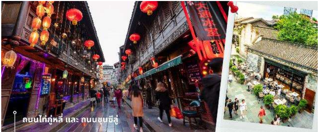
ถนนไท่กุ่หลี่ และ ถนนชุนซีลู่

จากนั้นให้ท่านให้อิสระกับการเลือกซื้อสินค้าของฝากที่ ถนนไท่กุ่หลี่ และ ถนนชุนซีลู่ ในย่านนี้เป็นถนนโบราณ ในอดีตเคยโรงงานผลิตผ้าไหมใหญ่ที่สุดในจีน ปัจจุบันได้เปลี่ยนเป็นถนนช้อปปิ้งแหล่งสวรรค์ของนักท่องเที่ยว เป็นถนนคนเดิน มีห้างสรรพสินค้าชื่อดัง มีร้านค้ามากกว่า 700 ร้านค้าที่เต็มไปด้วยสินค้าต่าง ๆ ทั้งร้านค้าแฟชั่น ร้านอาหารและโรงแรมนานาชาติมากมายซึ่งเป็นที่ยอดนิยมที่มีการเชื่อมต่อทางวัฒนธรรมท้องถิ่นที่เป็นแหล่งช้อปปิ้งและเป็นแหล่งร้านอาหารที่อร่อยต่าง ๆ มากมาย ซึ่งเป็นสถานที่เที่ยวของเฉิงตูที่ทำให้เพลิดเพลินกับสินค้าแบรนด์เนมและแบรนด์จีน เพื่อให้นักท่องเที่ยวได้เลือกซื้อตามอิสระ แะร้าน POP MART