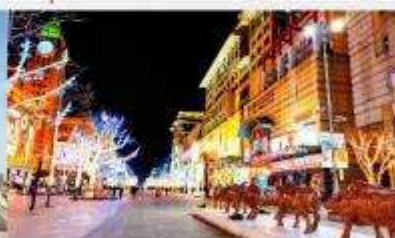
ถนนหวังฝูจิ้ง

*ทางบริษัทฯ ขอสงวนสิทธิ์ในการสลับโปรแกรมทัวร์ตามความเหมาะสมขึ้นอยู่กับสถานการณ์บ้านงาน โดยคำนึงถึงผลประโยชน์ของลูกค้าเป็นสำคัญ