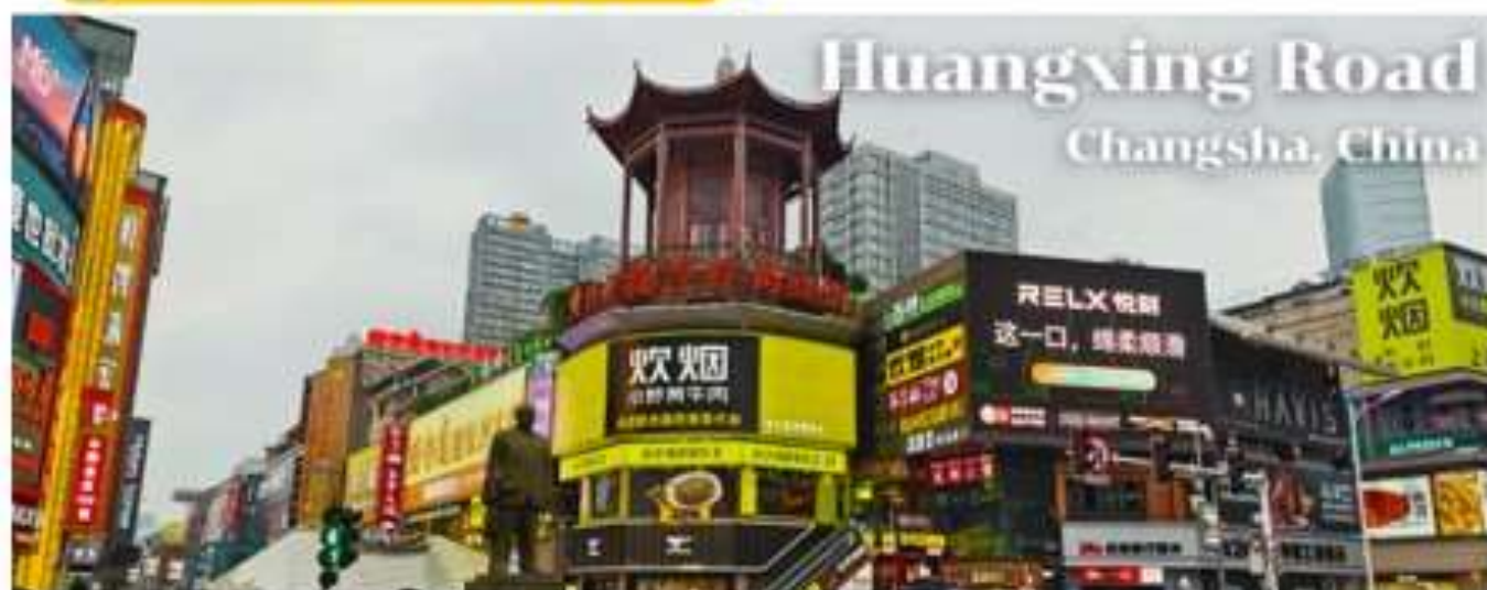
Huangxing Road Changsha, China

🕒 รับประทานอาหารเช้า นี้อที่ 13 # โรงแรม