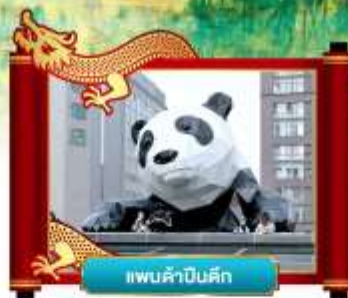
แพนดำเซลฟี