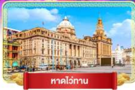
หาดไว่ทาน

• สัมผัสถนนสายวัฒนธรรม ถนนโบราณเฉียนเหมิน