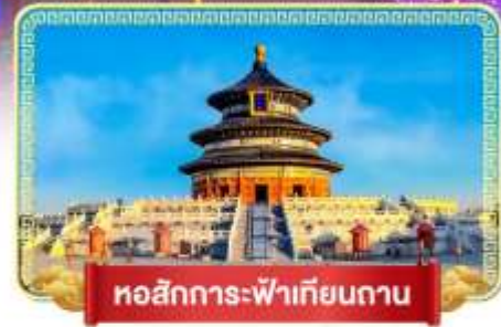
หอสังการะฟ้าเทียนถาน