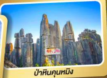
ป่าหินคุณหมิง