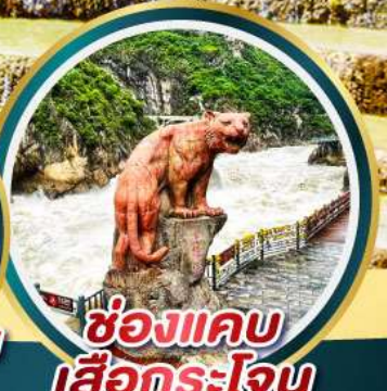
ช่องแคบ เสือกระโจน