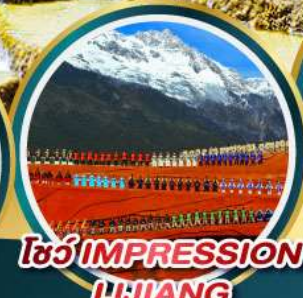
โซ่ว IMPRESSION LIJIANG