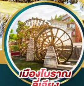
เมืองโบราณ ลี่เจียง