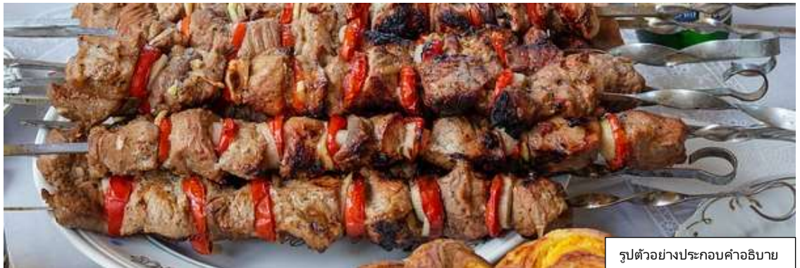
รูปตัวอย่างประกอบคำอธิบาย

เพิ่มพิเศษ เมนูจามรียงเครื่องเทศ 1 ท่าน / 1 ไม้ใหญ่