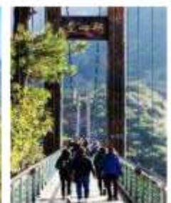
Wuyuan Glass Bridge

นำท่าน ขึ้นเดินไปกับเส้นทาง สะพานกระจกเมืองอู๋หยวน ทางเดินข้ามหุบเขาที่มีพื้นทางเดินเป็นกระจกใสช่วงกลางสะพาน สามารถมองเห็นวิวภายใต้ทางเดิน และวิวรอบหุบเขาได้อย่างชัดเจน ให้ท่านได้ถ่ายภาพ และขึ้นเดินไปกับการเดินชมทัศนียภาพอันงดงาม แสดงถึงเสน่ห์ของหุบเขาทางธรรมชาติที่ได้รับการอนุรักษ์ไว้ได้อย่างทะนุถนอม และกลมกลืนไปกับหมู่บ้านเกษตรกรผู้ปลูกดอกผักกาดก้านขาว (เรพซีด Rapeseed) ที่จะออกดอกบานสะพรั่งเป็นสีเหลืองอร่ามทั่วดินเขาในเดือน มีนาคมของทุกปี ทำให้นักท่องเที่ยวต่างพากันมาเยี่ยมชมหุบเขาในเดือนนี้กันมาก และสร้างความคึกคักให้กับบริเวณนี้ได้เป็นอย่างมาก