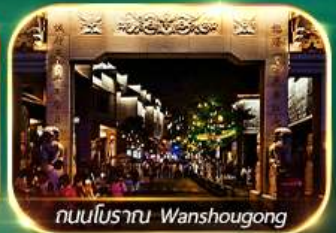
ถนนโบราณ Wanshougong

ตระการตาหุบเขาเทวดาฉีเจียนกู่ เช็กอินที่เที่ยงใหม่