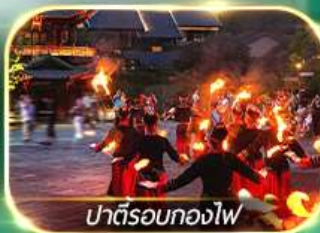
ปาร์ตี้รอบกองไฟ