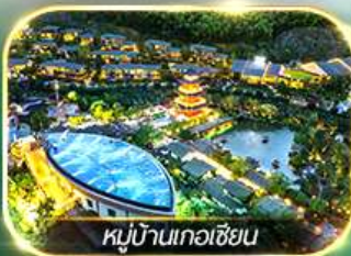
หมู่บ้านเกอเซียน