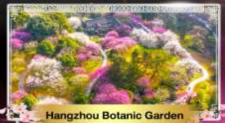
Hangzhou Botanic Garden