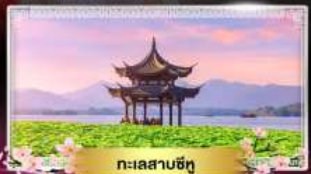
ทะเลสาบซีหู