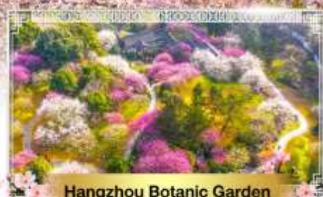
Hangzhou Botanic Garden