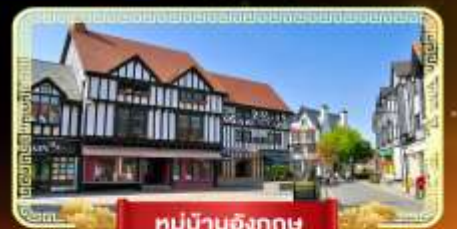
หมู่บ้านอังกฤษ