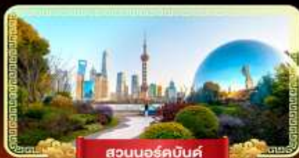
สวนนอร์คบันด์