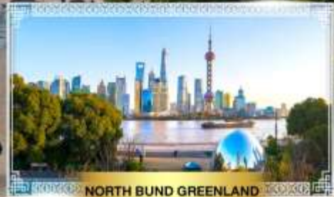
NORTH BUND GREENLAND