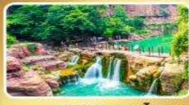
อุทยานหยุ่นโกซ่าน