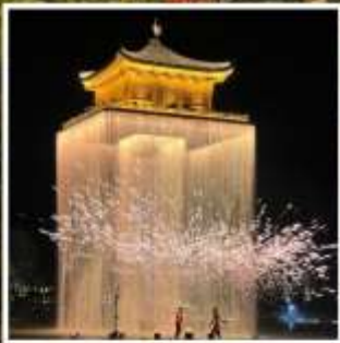
อู๋นวิโจว