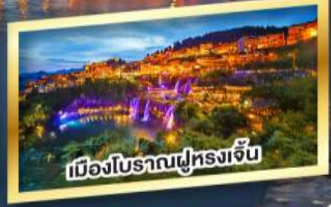
เมืองโบราณฟูหลงเจิ้น