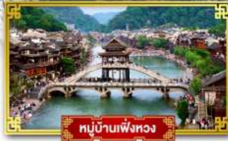
หมู่บ้านเฟิ่งหวง