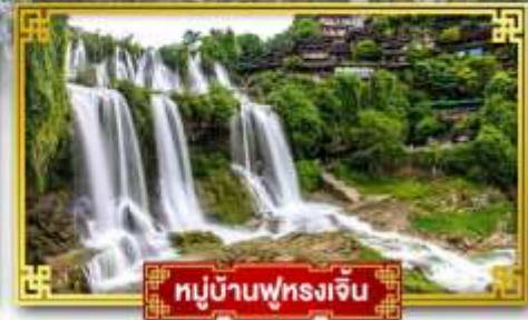
หมู่บ้านฟุทงเจิ้น