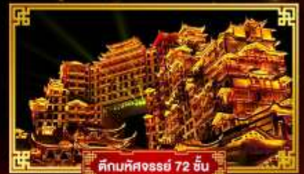
ตึกมหิศงจอร์รี่ 72 ชั้น