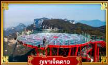
กุเขาเจ็ดดาว