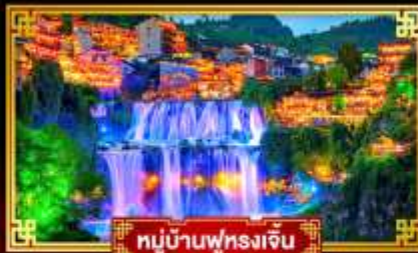
หมู่บ้านฟุทรงเจิ้น