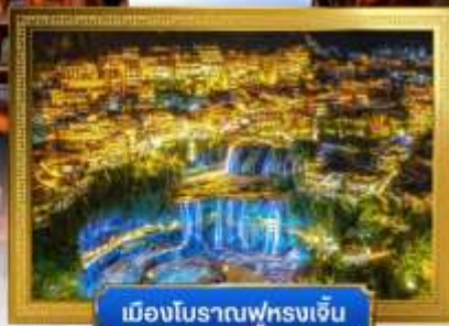
เมืองโบราณฟูหลงเจิ้น