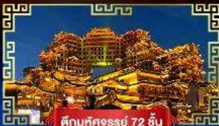
ตึกมหิตจรรยา 72 ชั้น