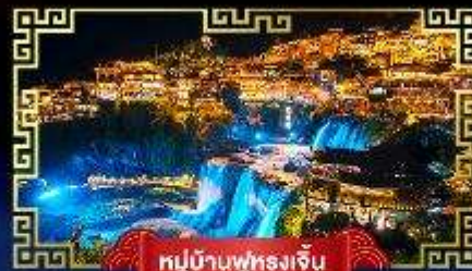
หมู่บ้านฟูหลงเจิน