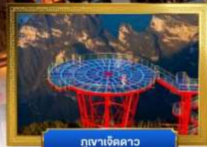
กุเวาเจ็ดดาว