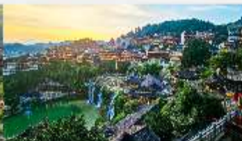
เมืองโบราณฟูหรงเจิน