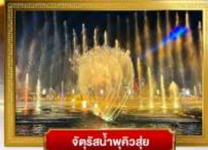
จัตุรัสน้ำพุที่สวยงาม