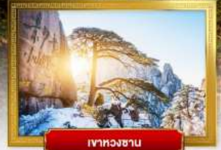
ภูเขาหวงซาน