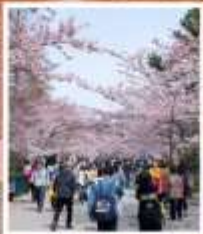
ซากุระจงซาบ