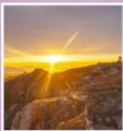
ยอดเขาอวิ้อวาง