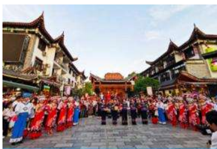
เมืองเทพริดา