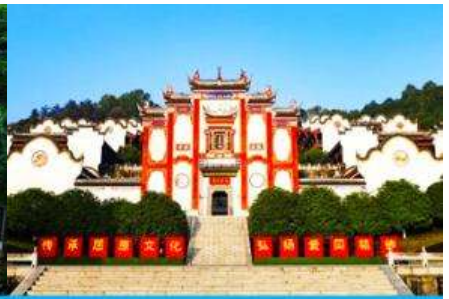
บ้านเกิดกวี ขวี่หยวน

วันที่สอง ล่องเรือแม่น้ำแยงซีเกียง-เขื่อนลิฟท์น้ำ-สวนถ้ำสามสหาย-บ้านเกิดกวี ขวี่หยวน-เมืองเทพริดา