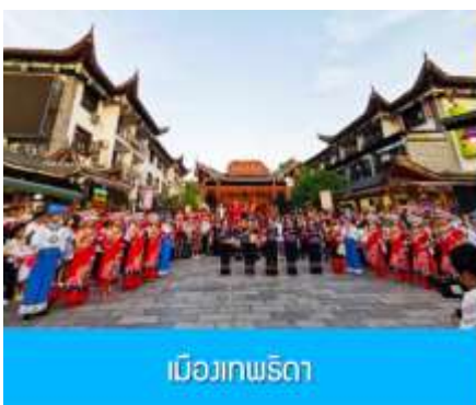
เมืองเทพธิดา