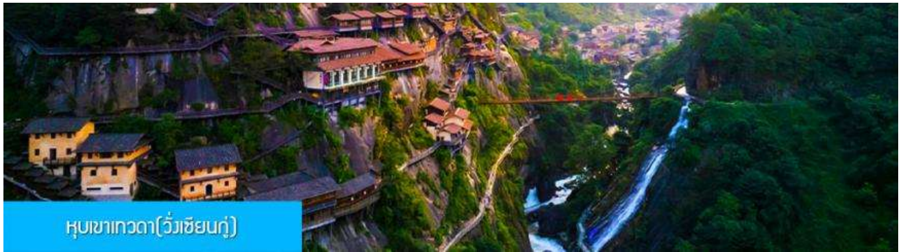
หุบเขาเทวดา(วังเซียนกู่)

เที่ยง รับประทานอาหารกลางวัน ณ ภัตตาคาร หลังอาหารเช้าท่านเดินทางสู่เมือง ชั่งเหลา 上饶 (ระยะทาง 127 กม. ใช้เวลาเดินทางโดยรถบัสราว 2 ชั่วโมง)