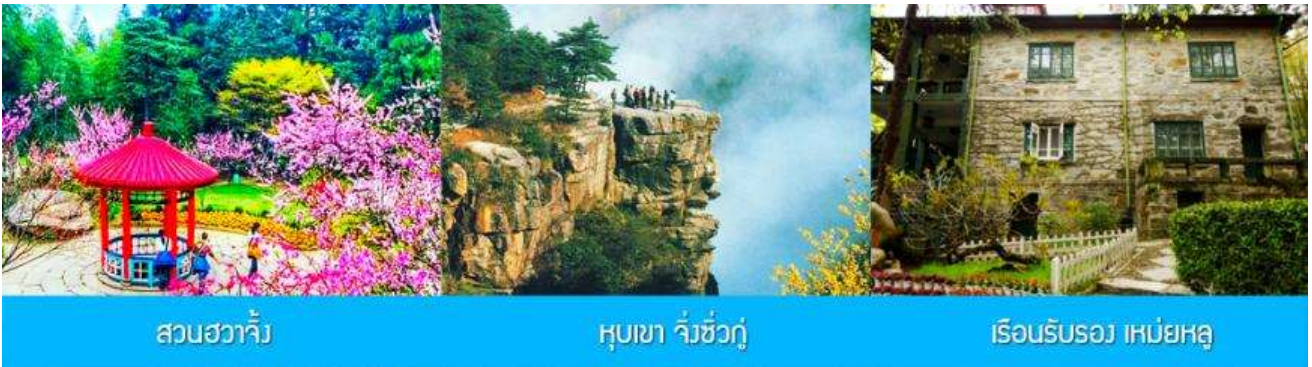
สวนฮวาจิ้ง