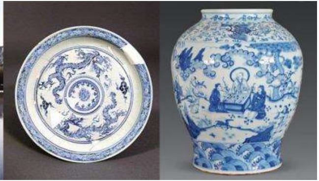
เตาเผาเครื่องลายครามจีนโบราณ

หลังอาหารนำท่านชม เตาเผาเครื่องลายครามจีนโบราณ 景德镇官窑 เป็นโรงงานผลิตเครื่องลายครามจีนโบราณที่ผลิตเครื่องใช้ต่าง ๆ (เครื่องลายคราม) อาทิ แจกันประดับบ้าน ถ้วยชาม บรรจุภัณฑ์ที่ใช้ในบ้าน เพื่อส่งถวายให้เป็นเครื่องใช้ในวังสำหรับจักรพรรดิ และพระบรมวงศานุวงศ์ เครื่องลายครามที่ผลิตจากโรงงานแห่งนี้ได้ชื่อว่าเป็นเครื่องลายครามที่ดีที่สุดในพื้นที่จีน ซึ่งของที่ผลิตได้ทุกชิ้นหลังผ่านการคัดกรองแล้วจะถูกส่งไปในพระราชวังที่กรุงปักกิ่ง ส่วนที่เหลือจากการคัดกรองจะถูกทุบให้แตกและนำมาเผาใหม่ โดยไม่สามารถนำไปขายให้กับสามัญชนทั่วไปได้.....นำท่านชมเตาเผาโบราณ และเครื่องลายครามโบราณรุ่นต่าง ๆ ซึ่งบางส่วนยังคงถูกเก็บรักษาไว้เป็นอย่างดี