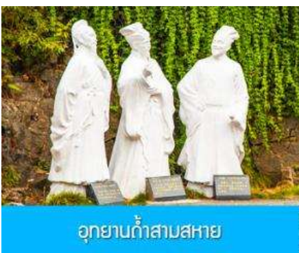
อุทยานง้าวสามสหาย

พักที่ XIA ZHOU BINGUAN HOTEL โรงแรมระดับ 4 ดาวหรือเทียบเท่าใจกลางเมืองหยีชาง