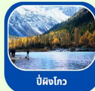
ป่ผิงโกว

เดินทาง : 17-22 พค // 20-25 มิย 8-13 กค 2568