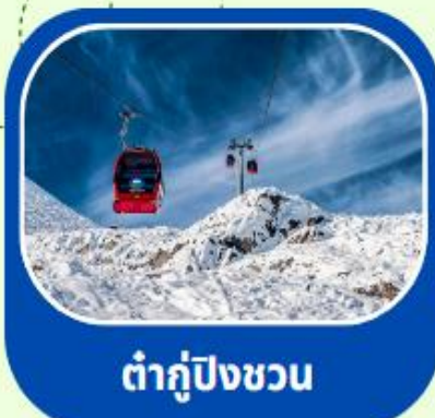
ต้ากู่ปิงชวน

ทัวร์ไม่ลงร้าน+ไม่ขายออฟชั่น+บินFullService