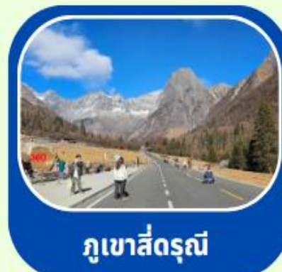
ภูเขาสีดรุณี