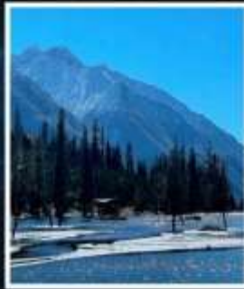
อุทยานชวงเจียวโกว