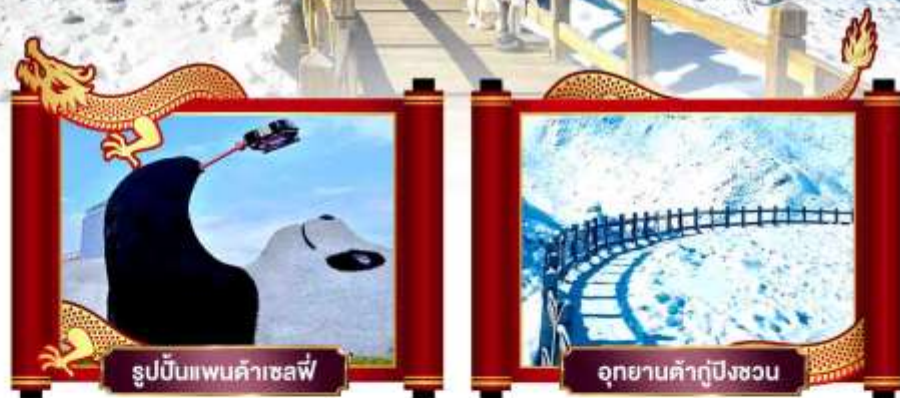
รูปปั้นแพนด้าเซลฟี่