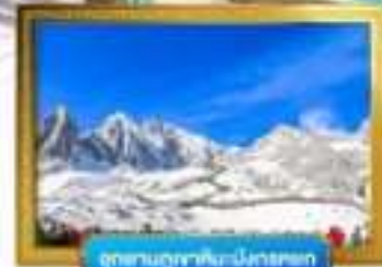
อุทยานภูเขาหิมะมังกรหยก

เดินทางโดยสารการบินจีนนำอิสเทิร์นแอร์ไลน์