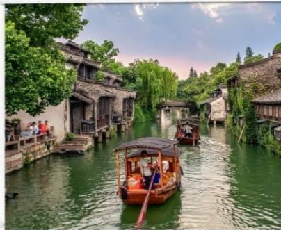
เมืองโบราณอูเจิ้น