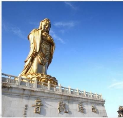
เกาะผู้ไถวซาน