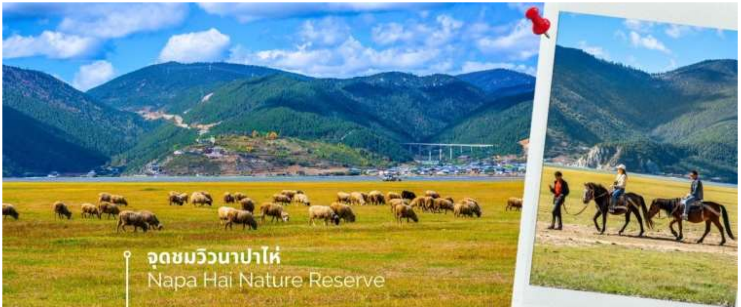
จุดชมวิวนาปาไห่ Napa Hai Nature Reserve

จากนั้นเดินทางไปยัง จุดชมวิวนาปาไห่ พื้นที่ราบสูง ที่สูงขึ้นไปมากถึง 3,266 เมตรจากระดับน้ำทะเล ครอบคลุมพื้นที่ 660 กิโลเมตร ห้อมล้อมไปด้วยเทือกเขาทั้ง 3 ด้านและมีลำธาร 2 สายไหลมารวมกัน ความอลังการของวิวทิวทัศน์ที่ทำให้คนต่างก็อยากขึ้นไปชื่นชมที่สูงขนาดนั้น ก็เพราะความสวยงามที่เปลี่ยนไปตามแต่ฤดูกาล สวยงามทั้งปี จะเป็นช่วงที่ทุ่งหญ้าเขียวขจีและดอกไม้ขึ้นบานสะพรั่ง ช่วงฤดูหนาวเทือกเขาและทะเลสาบชาวโพลน บรรยากาศฤดูร้อนจะสดใส ท้องฟ้ากระจ่าง และจะพบเหล่าฝูงม้า แกะและจามรีที่ลงมาทะเลสาบที่เป็นแหล่งน้ำและอาหาร