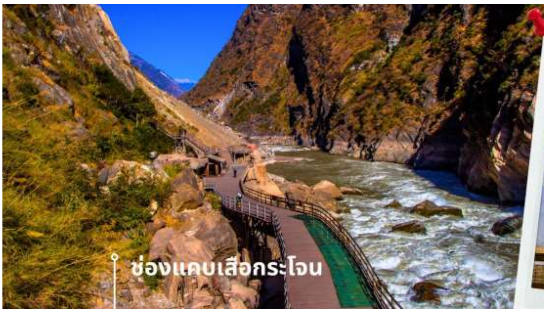
ช่องแคบลือกระโจน

นำท่านแวะชม ช่องแคบลือกระโจน (รวมค่าบริการบันไดเลื่อน ขึ้น-ลง) ซึ่งเป็นช่องแคบช่วงแม่น้ำแยงซีไหลลงมาจากจินซาเจียง(แม่น้ำทรายทอง) เป็นช่องแคบที่มีน้ำไหลเชี่ยวมาก ช่วงที่แคบที่สุดประมาณ 30 เมตร