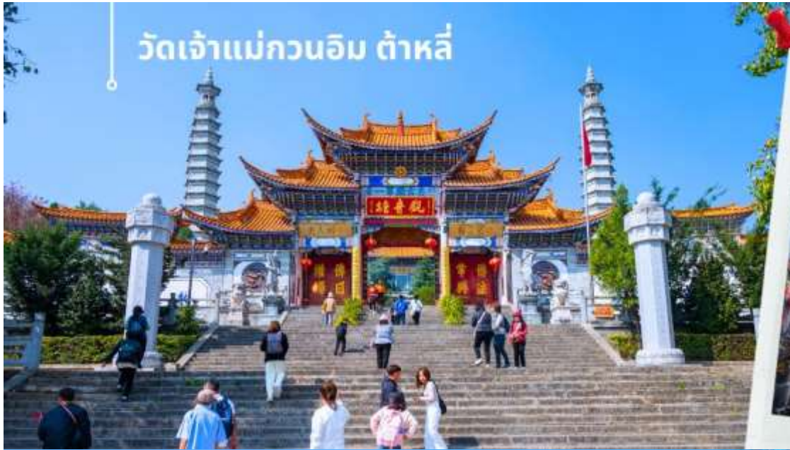
วัดเจ้าแม่กวนอิม ตำบลลี่