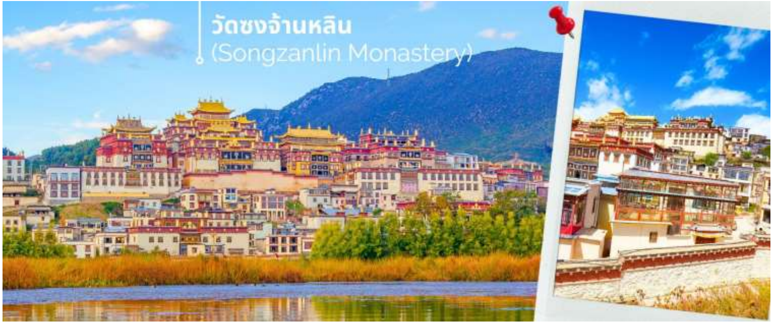
วัดซงจันหลิน (Songzanlin Monastery)