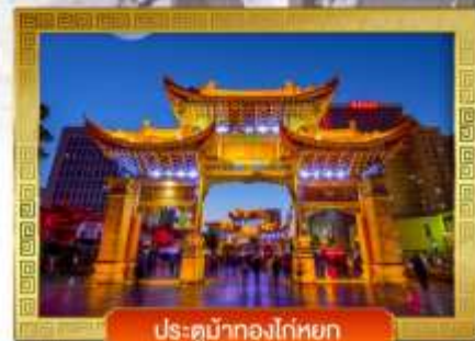
ประตูม้าทองโก่หยก