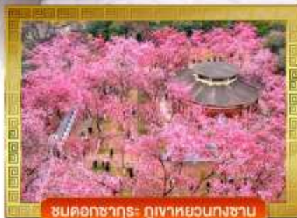
ชมดอกซากุระ ภูเขาหยวนกงซาน