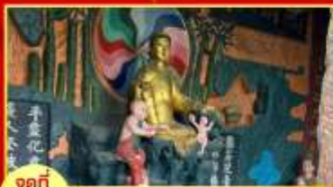
จุดที่ 4 ศาลเจ้าแม่กวนอิมส่งลูก