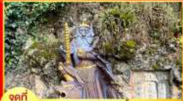
จุดที่ 1 เทพเจ้าไฉ่ซิงเอี้ย หรือ เทพเจ้าแห่งโชคลาภ