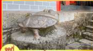
จุดที่ 2 รูปปั้นงูพันเสา ข้าง ศาลเจ้าพ่อเสือ