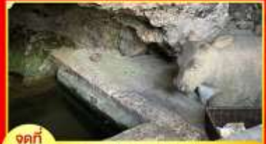
จุดที่ 3 บ่อน้ำศักดิ์สิทธิ์วัดคณฺหุ