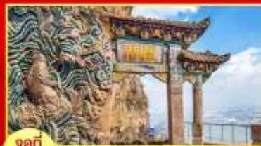
จุดที่ 5 ซันประตุมังกร

ค่า จากนั้น ๑๐ บริการอาหารเย็น ณ ภัตตาคาร มือพิเศษ! เมนูสุกี้เด็ด พักที่ WEI ER DUAN HOTEL หรือระดับเทียบเท่า ★★★★★