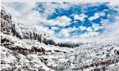
ภูเขาหิมะเจียวจื่อ