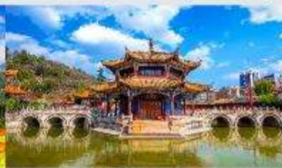
วัดหยวนทง