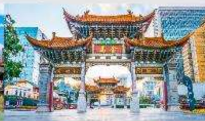
ประตุน้ำทอง ไท่หยก

*ทางบริษัทฯ ขอสงวนสิทธิ์ในการสลับโปรแกรมทัวร์ตามความเหมาะสมขึ้นอยู่กับสถานการณ์หน้างาน โดยคำนึงถึงผลประโยชน์ของลูกค้าเป็นสำคัญ