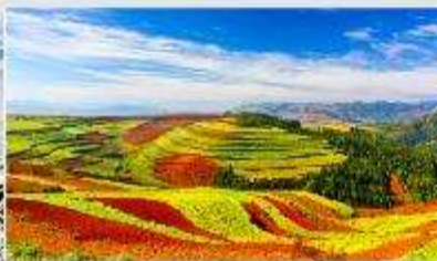
แผ่นดินสีแดง